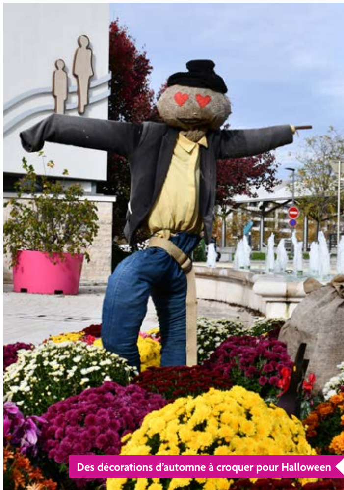
Des décorations d'automne à croquer pour Halloween