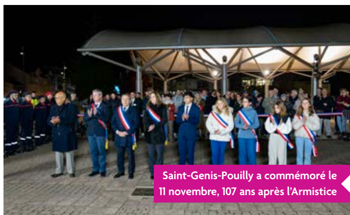
Saint-Genis-Pouilly a commémoré le 11 novembre, 107 ans après l'Armistice