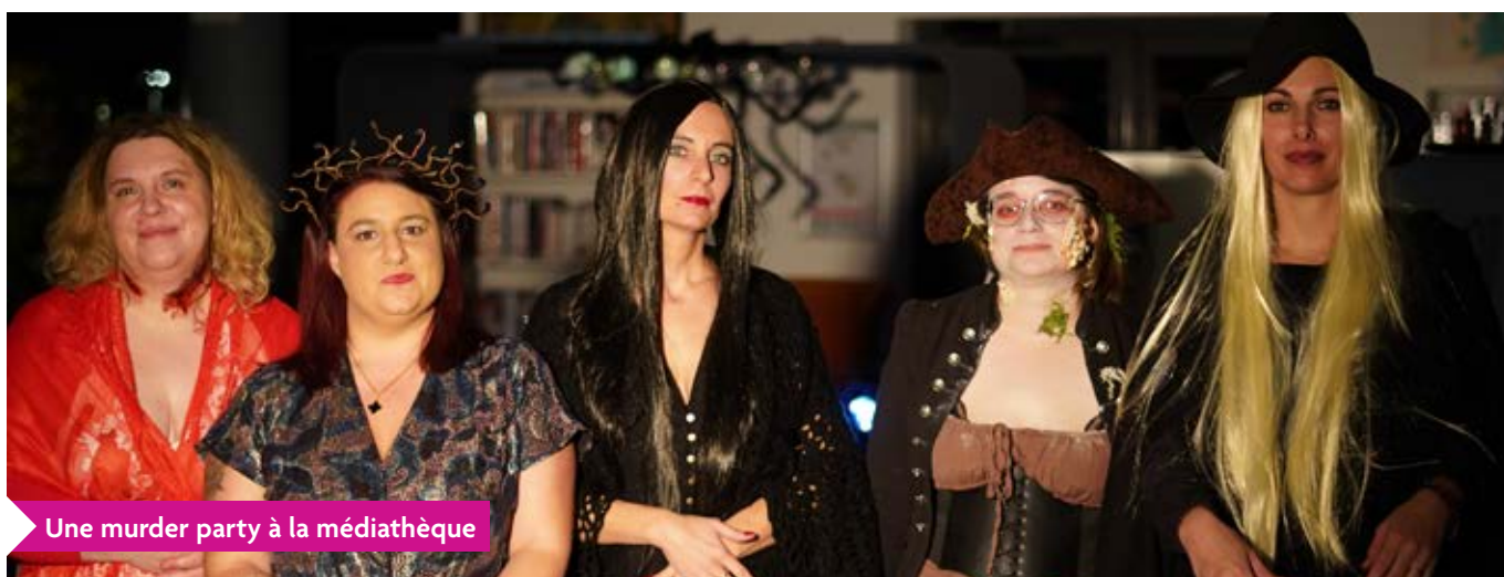
Une murder party à la médiathèque