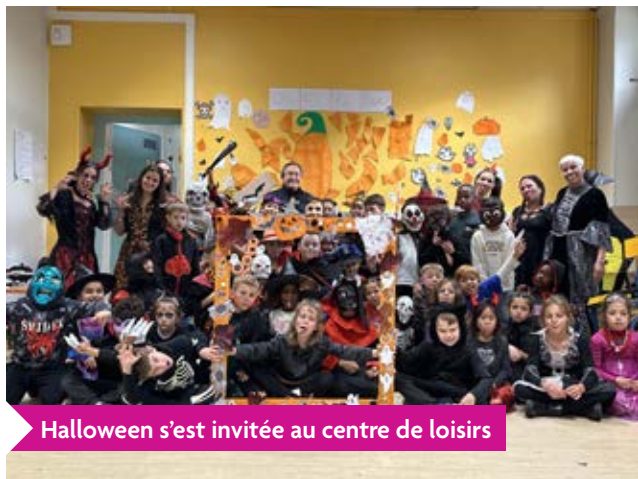
Halloween s'est invitée au centre de loisirs