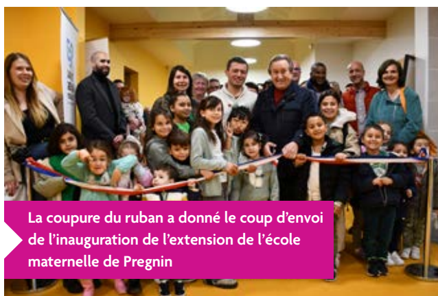
La coupure du ruban a donné le coup d'envoi de l'inauguration de l'extension de l'école maternelle de Pregnin